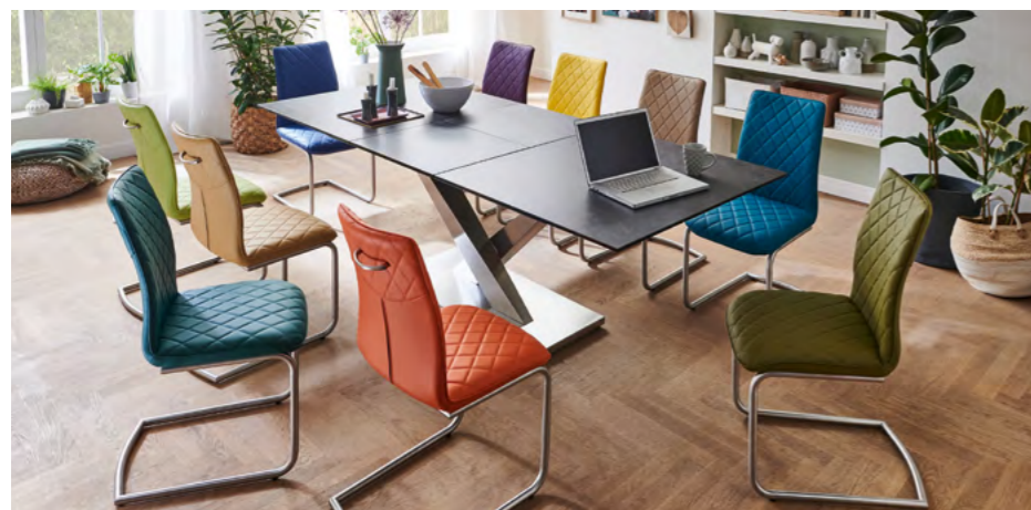
MONDO SPECIAL EDITION: HAPPY COLORS

9 zusätzliche, attraktive Kunstleder-Bezugvarianten für MONDO AMATI